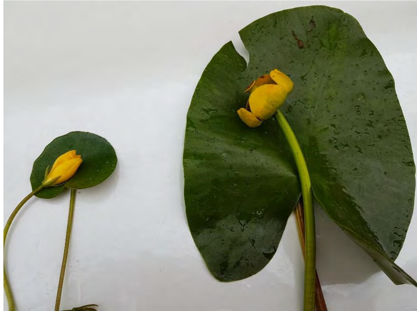
Vasemmalla keltalammikki ja oikealla ulpukka