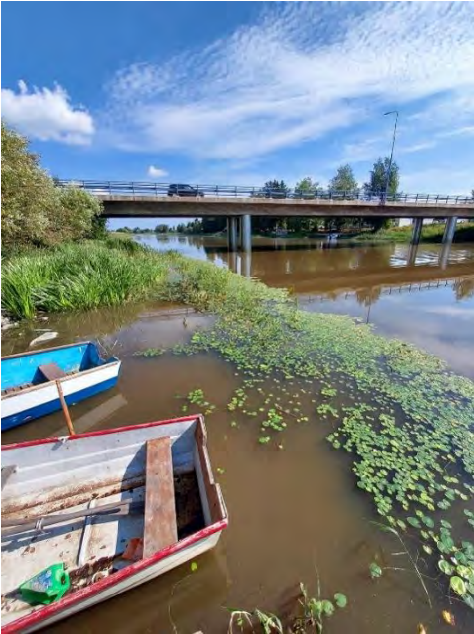
Viikko toisesta torjunnasta