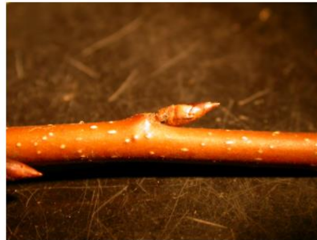
Tuomikirvan talvimuna silmussa

Tuomikirvaennuste 2021 – näytteenottopyyntö