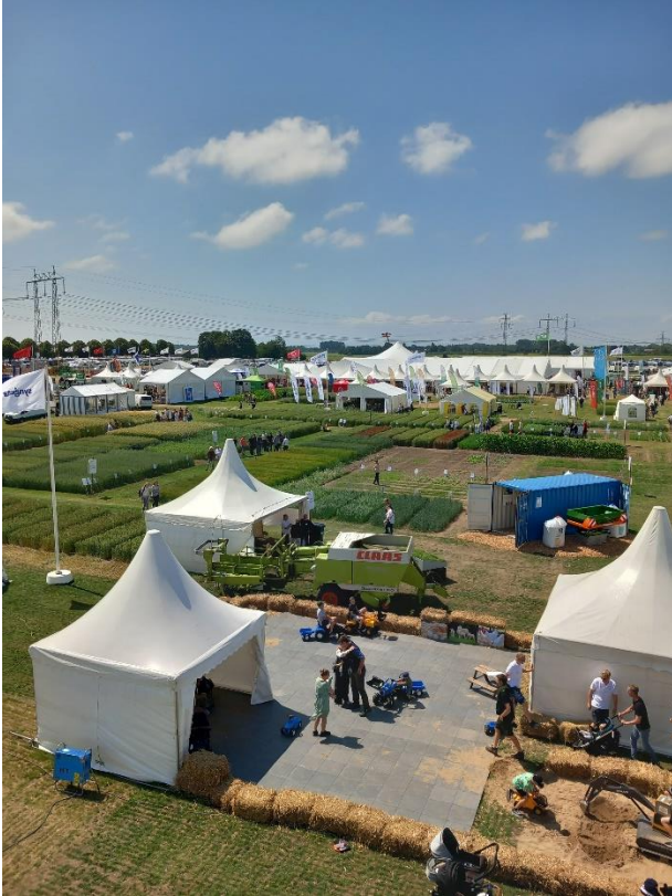
Borgeby Fäldagar oli iso tapahtuma ja tarjosi paljon katsottavaa ja ihmeteltävää koko päiväksi.

osastoilla. Opintomatkaseurueemme jäsenet kiertelivät mielenkiintoisilla osastoilla ja näytöksissä aktiivisesti koko päivän ja haastattelivat myös ruotsiksi tai englanniksi näytteilleasettajiä.