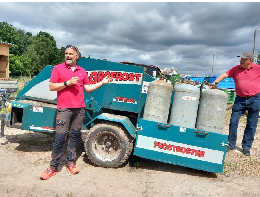
Hallantorjuntaan omenalta käytettiin koneistusta.