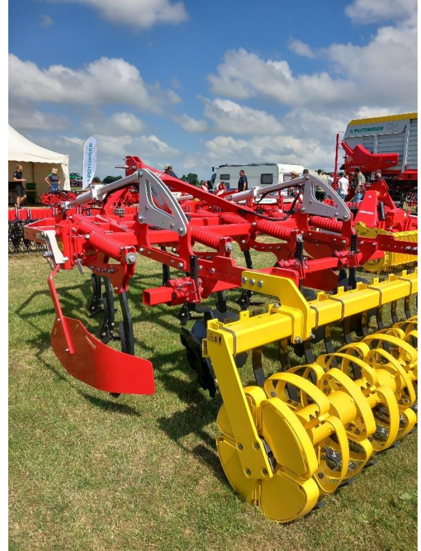
Koneita oli esillä iso määrä ja ne olivat kooltaan valtavia.