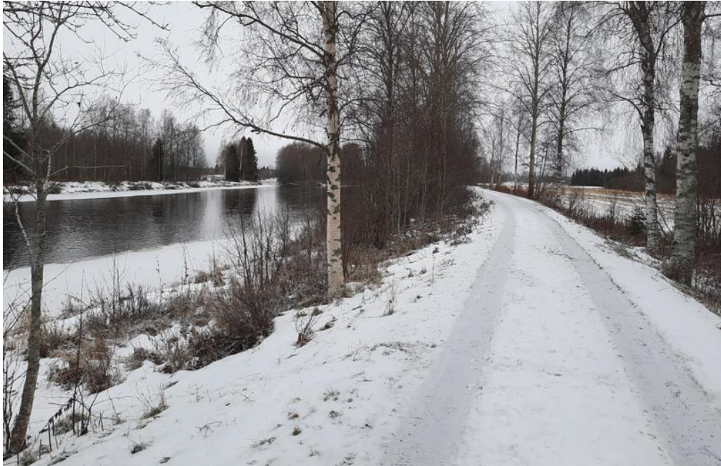
Kuva 4. Penkkatie Huhannivan kohdalla 10.11.2023.

säilymisestä. Perinnebiotoopit tarjoavat myös muita ainutlaatuisia elinympäristöjä, kuten laidunten lantakasoja lantakuoriaisille ja paahteisia ketohietikoita maamehiläisille. Perinnebiotoopit ovat monimuotoisimpia, mutta samalla uhanalaisimpia elinympäristöjä Suomessa.