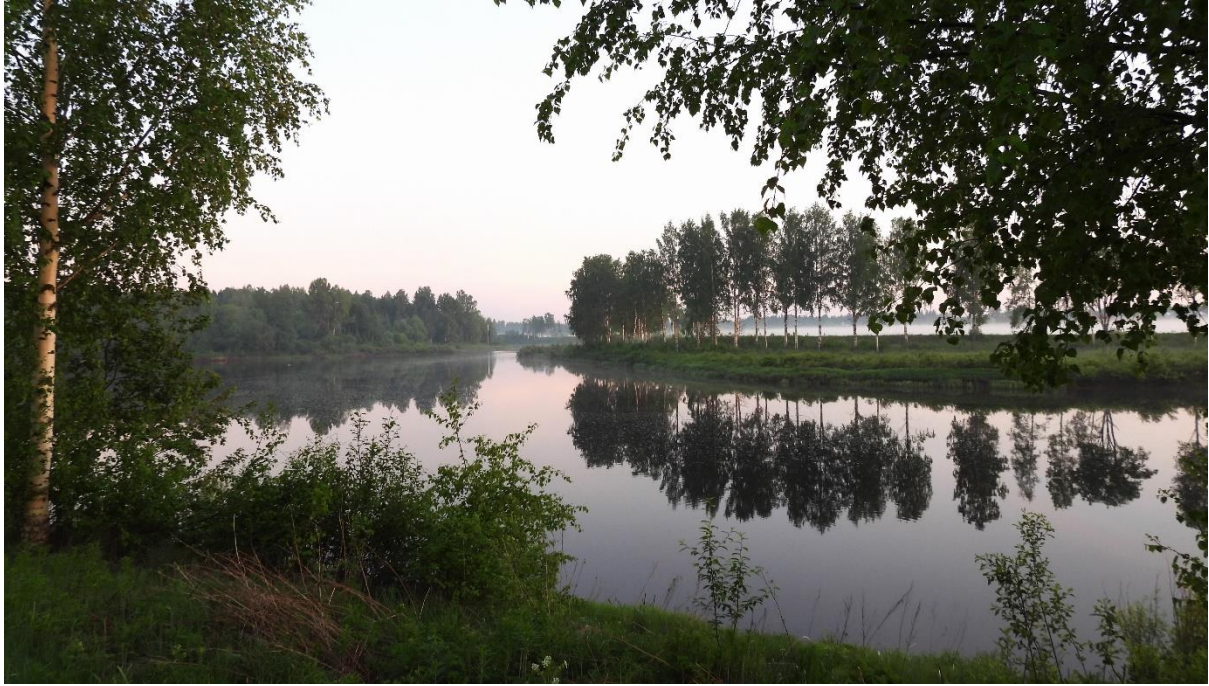
Kuva 1. Petäjaskosken maisemaa kesäyönä.