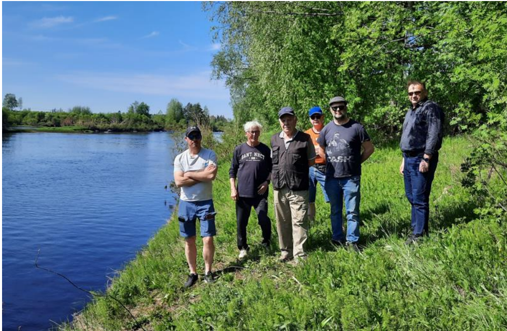
Kuva 5. Maastokatselmuksen väkeä Pulkonniemen kohdalla 27.5.2024.