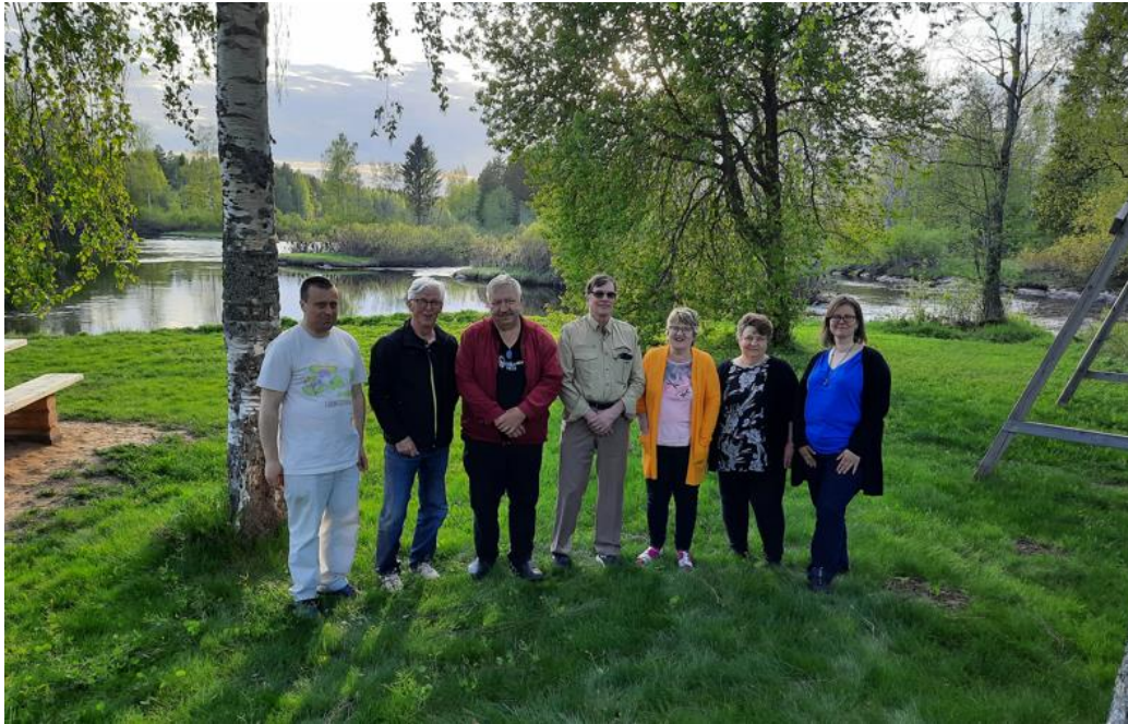
Kuva 3. Petäjäskosken kyläyhdistyksen ja hankkeen väkeä Koskikeitaalla toukokuussa 2022.

Jokivarren maisemanhoidon järjestämistä ja rantojen virkistyskäytön kehittämistä pohdittiin maastokäynnillä 27.5.2024. Mukana oli 7 henkilöä: kyläläisiä, Oulaisten kaupungin, Rieska Leaderin, Pyhäjoen vesistö ry:n ja hankkeen edustajat (Kuva 5). Leader-rahoituksen ohella esille nousi mahdollisuus hakea harkinnanvaraista vesienhoitoavustusta ELY-keskuksesta loppuvuodesta. Sen hakuehdoissa on mainittu tulvasuojelun aiheuttamien haittojen lieventämiseen liittyvien toimenpiteiden rahoittaminen. Sovittiin, että autetaan kyläyhdistystä ja Pyhäjoen vesistö ry:tä hakemaan avustusta.