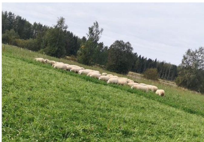
Väliaitaa viedään eteen päin 1–3 pv välein. Kuvassa näkyy lisätyn kaistan raja; lampaat uudella kaistalla.