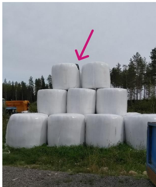
Kiinnitä huomiota varastointiin. Reiät tulee teipata heti. Älä pinoa märkiä paaleja. Käsittele paaleja varovasti.

HAPPAMUUS. Happoon pohjautuvat säilöntäaineet laskevat pH:n nopeasti. Biologisten säilöntäaineiden teho perustuu maitohappobakteeriymppeihin. Maitohappobakteerit käyttävät rehun sokereita maitohapon muodostamiseen. Maitohappo on säilövä happo, laskien rehun pH:n alas. Säilörehu säilyy myös ilman säilöntäaineita, kun hapettomuus ja hygienia ovat kunnossa, mutta käymisprosessi ei ole yhtä hallittua kuin hapolla säilöittäessä. Säilöntäaineiden käyttöä on hyvä pohtia etenkin olosuhteiden ollessa haastavia korjuuaikana.