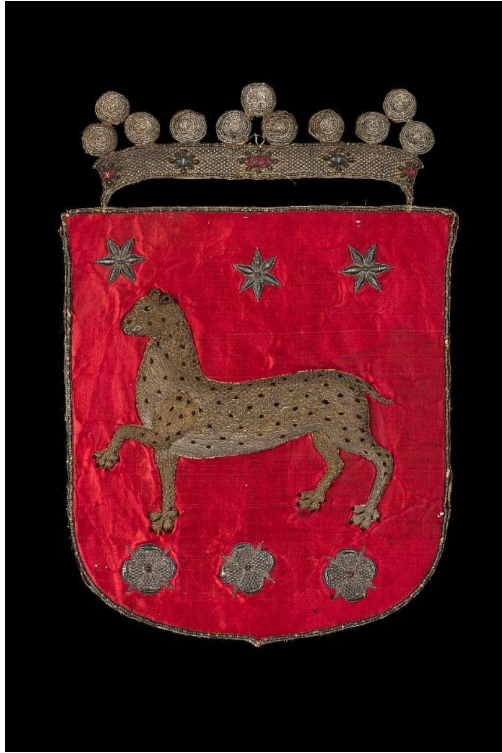
Kaarle X Kustaa