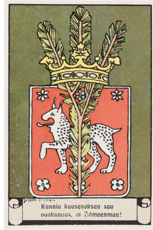
Kuva: Joseph Alanen (Museovirasto)