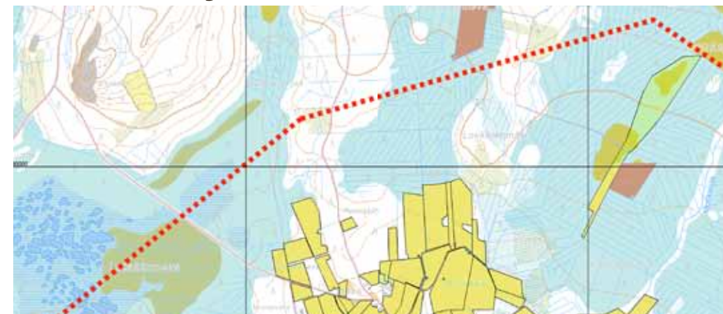
TILUSRAKENNE ON SARKAJAON JÄLJILTÄ PAIKOITELLEN YHÄ PIRSTALEINEN. Tilusjärjestely järkevöittää rakennetta ja avaa uusia mahdollisuuksia maankäyttöön.

M IKSI TEHDÄ TILUSJÄRJESTELYJÄ? Historialliset tilusrakenteet eivät palvele parhaalla mahdollisella tavalla kylien asuinrakentamista, infrastruktuuria, aiempaa huomattavasti suurikokoisempia ja lukumäärältään vähäisempiä maatiloja eivätkä niiden tuotantotekniikkaa. Pienilläkin, kyläläisten ja maanomistajien kanssa yhteistyössä räätälöidyillä, tilusten järjestelyillä on mahdollista parantaa huomattavasti kylän maankäyttöä.