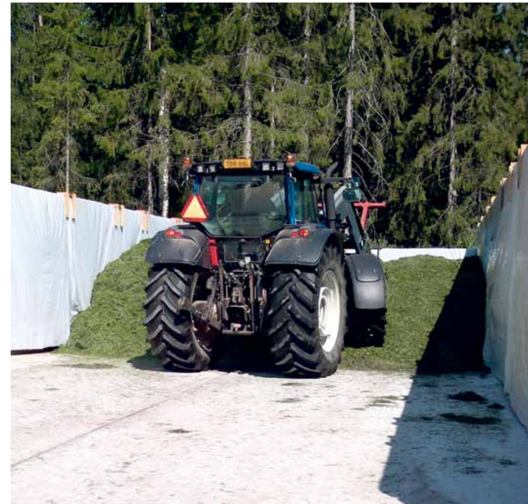
MUISTA Huolellinen tiivistäminen on avainkysymys vakaan säilörehun saamiseksi.

S äilörehun lämpeneminen on ollut tämän ruokintakauden erityispiirre. Rehurintauksen nopea eteneminen pitää epävakaa säilörehun laadun vielä hallinnassa, mutta pienillä syöttömäärillä suhteessa avattuun leikkuupintaan ongelma on suuri. Kukaan ei varmaankaan ole rehua tehdessään ajatellut, että siilon rinta-osa olisi irrotuskohdasta jo kahden päivän päästä valkoisessa homeessa tai että rehun lämpötila ylittäisi jopa 60 astetta.