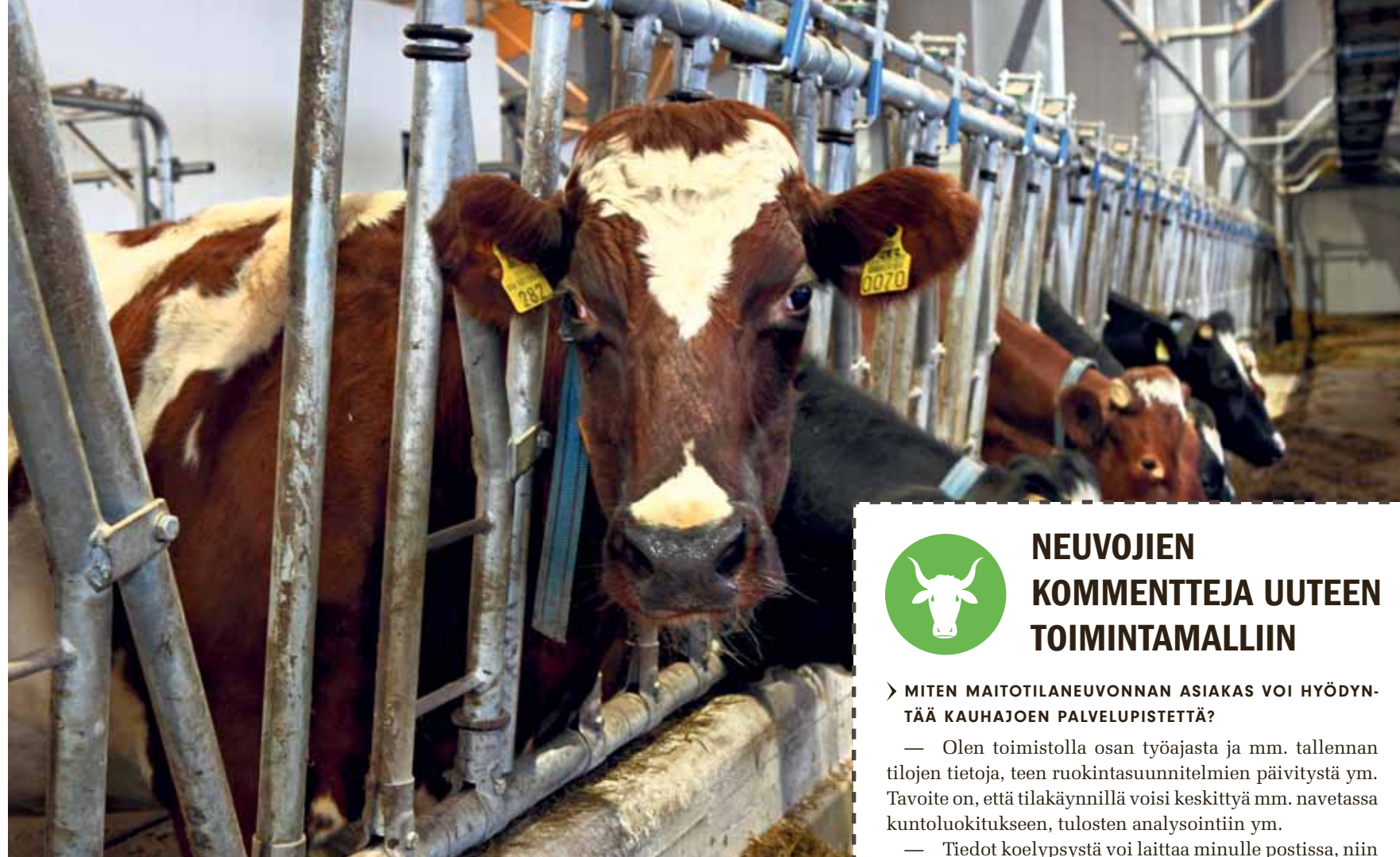
MAITOTILOJEN SOPIMUKSET uusitaan kaikilla asiakastiloillamme viimeistään helmikuun aikana.