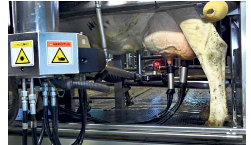
TILALLA alkoi robottilypsy elokuussa.

Navetassa on toimiva ohjattu liikenne kaksoiskierroksineen. Lehmien robottikierto pyörii kolmen kieppeillä ja tyytyväisiä ollaan! Ruokintajärjestelyissä päädyttiin matoruokkijaan, koska tällöin on tuoretta rehua saatavilla koko ajan.