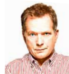
Sauli Niinistö WWW.NIINISTO.FI

1. Viljelijät tekevät arvokasta työtä, jota ilman Suomi ei pärjäisi. Maatalouden kannattavuuden parantamisessa keinona näen yhä vahvemman panostamisen markkinoille sekä kuluttajälähtöisyyden. Eli vastataan yhä paremmin kuluttajien kysyntään ja tuodaan yhä aktiivisemmin esille suomalaisen ruoan hyviä puolia. Näin voidaan pyytää tuotteista käypää hintaakin. Hyvänä esimerkkinä voisi nostaa monien tuottajien ja myös kaupan aktiiviset toimet lähiruuan tarjonnan lisäämiseksi. Myös maatalouden tukijärjestelmän tulee olla toimiva ja riittävä, mutta se tosiasia on nähtävä, etteivät tuet nykyisestä nouse. Positiivisena kädenojennuksena hallituksen suunnalta näen maatalouden ottamisen mukaan nyt tehtyyn raamiratkaisuun jäädyttämällä energiaveropalautuksen pienentäminen, sitoutumalla viljelijöiden työhyvinvoinnin kehittämiseen sekä selvittämällä erillistä kiinteistöverokantaa maatalouden tuotantorakennuksille.