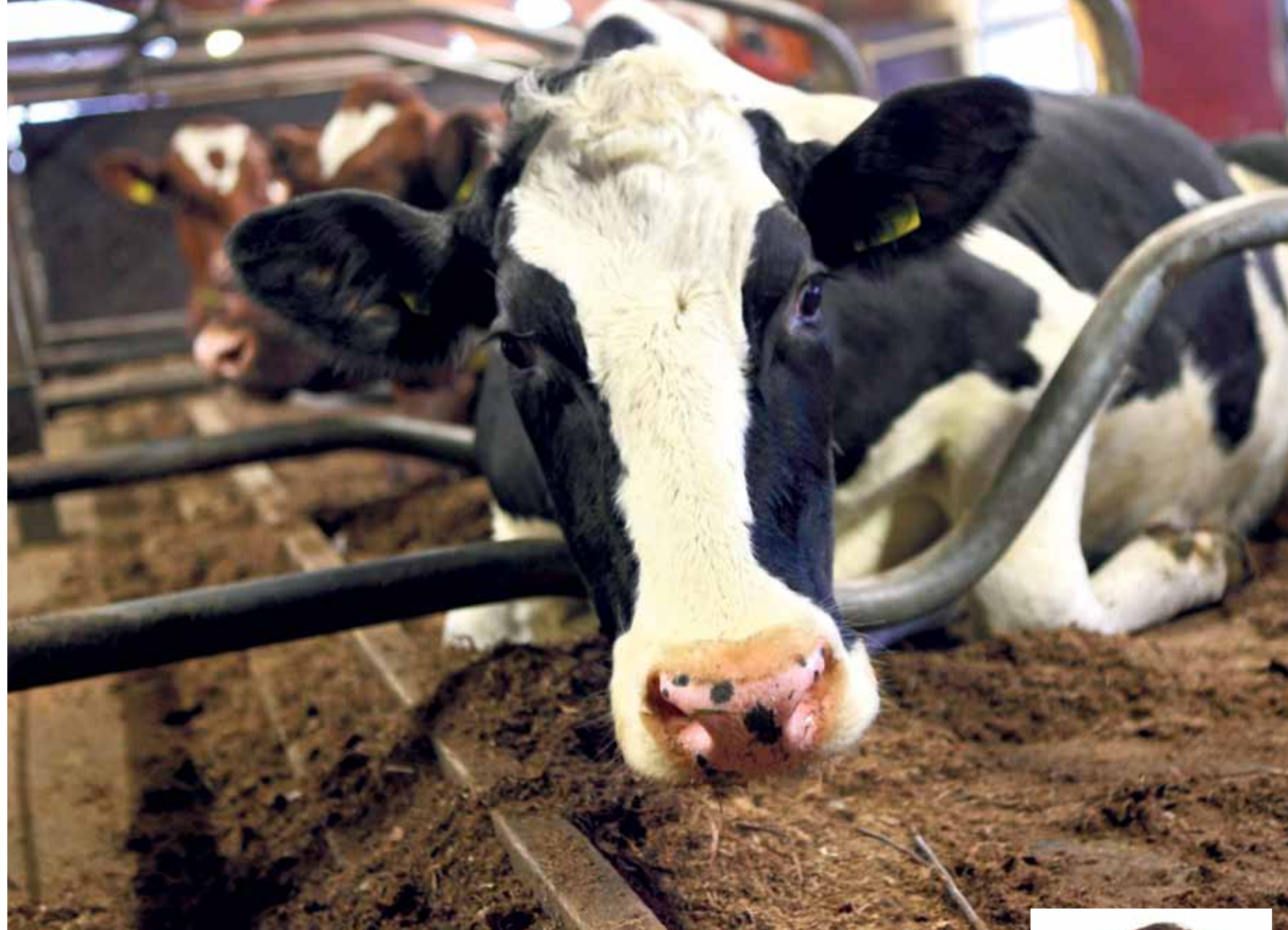
NAVETASSA Mitähän tänne tulee kun me muutetaan pois?