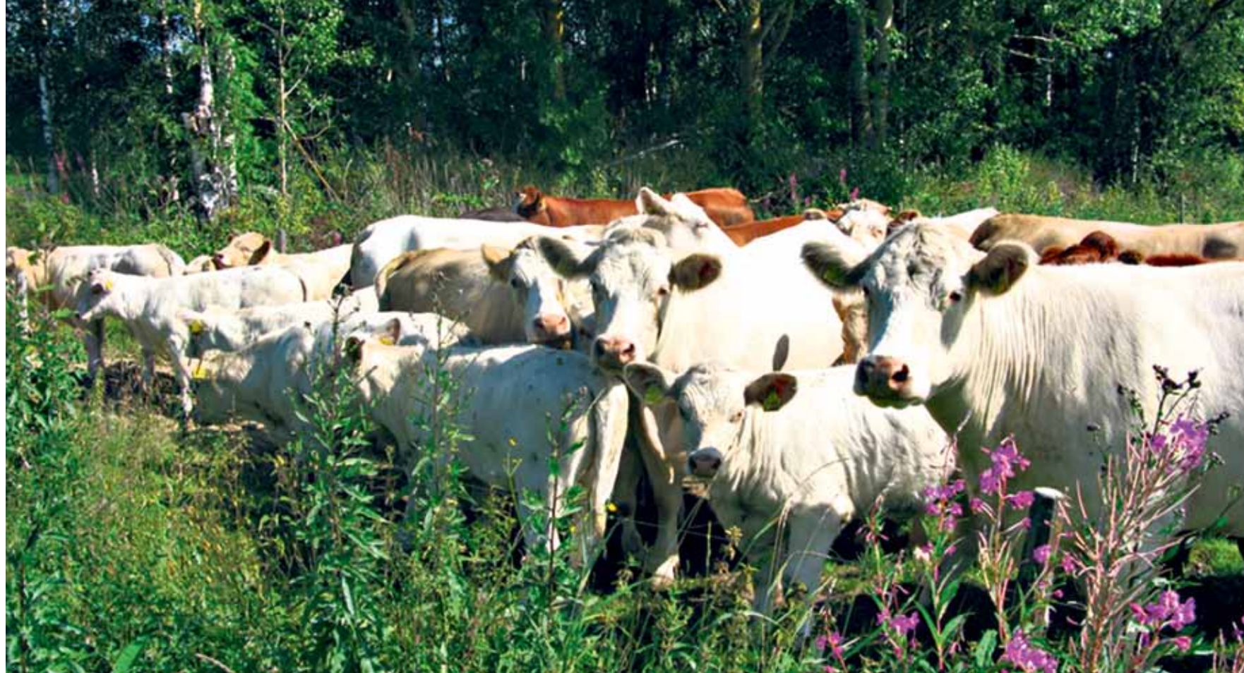
SIKANAUTA-HANKEEN OPINTOMATKOILTA tilat ovat hakeneet vinkkejä ja kannustuksia omien valintojensa tueksi.