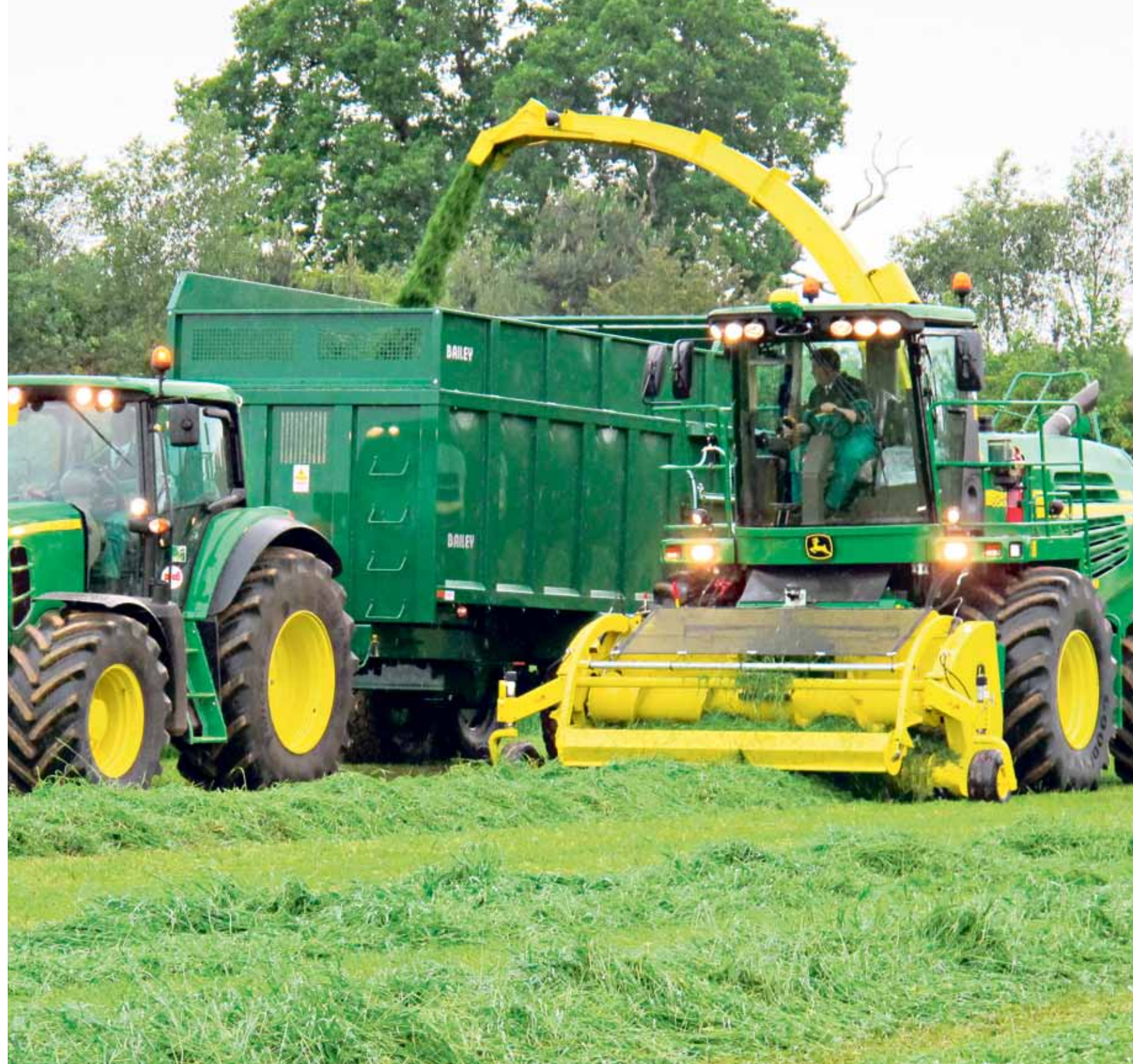
REHUNTEOSSA Säitä emme voi hallita - mutta niihin sopeutumalla voi saada hyvää rehua aikaiseksi.