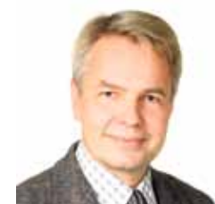
Pekka Haavisto WWW.HAAVISTO2012.FI

3. Ehdottomasti Farmari-maatalousnäyttelyssä vierailu laitetaan allakkaan, jos valituksi tulen.